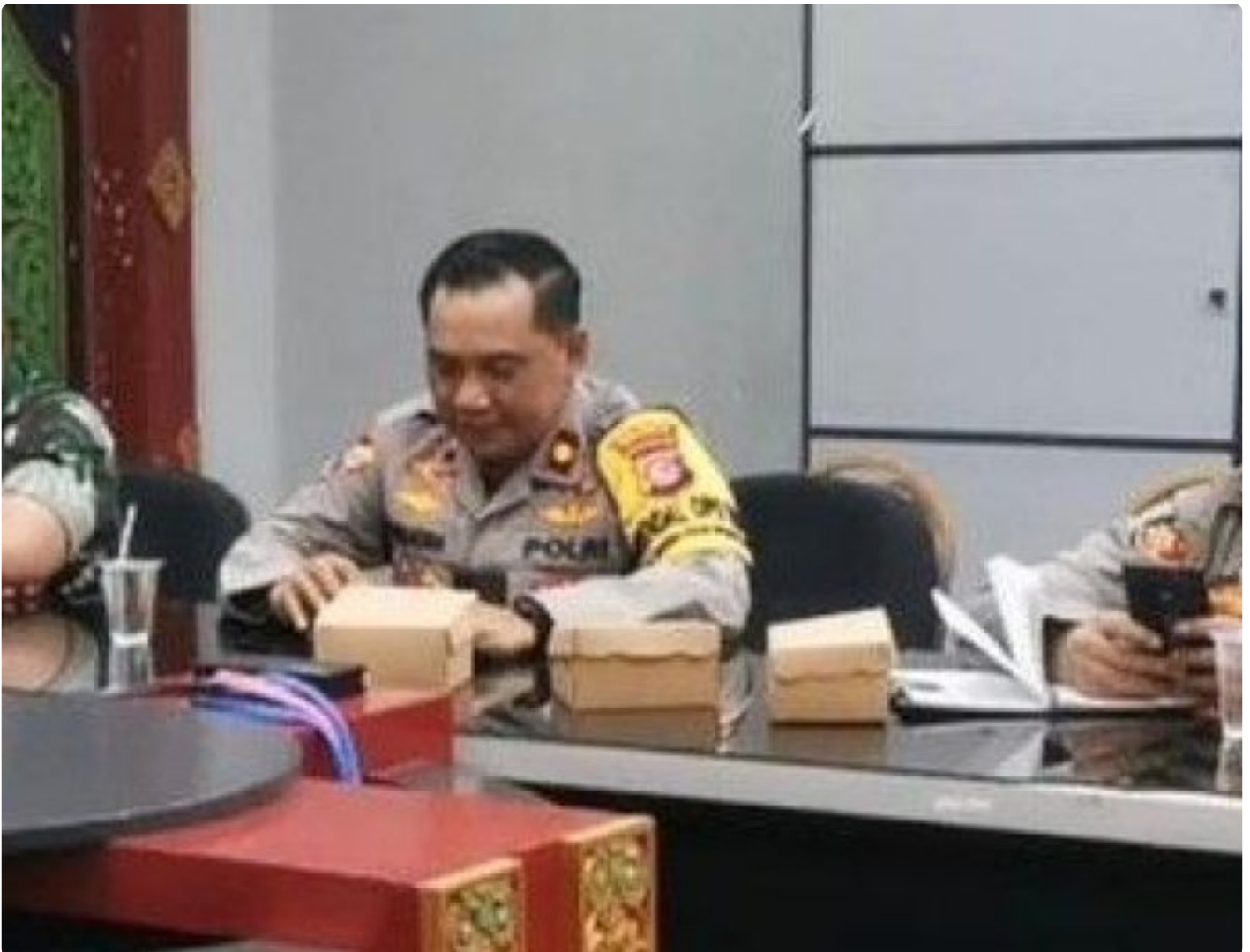
Kabagops Polresta Mataram saat menghadiri Rakor di Kantor Bupati Lombok Barat, Selasa (10/12/2024)

MATARAM, NTB – Dua tradisi budaya ikonik, Pujawali dan Perang Ketupat, akan kembali digelar di Pura Lingsar, Kecamatan Lingsar, Kabupaten Lombok Barat.